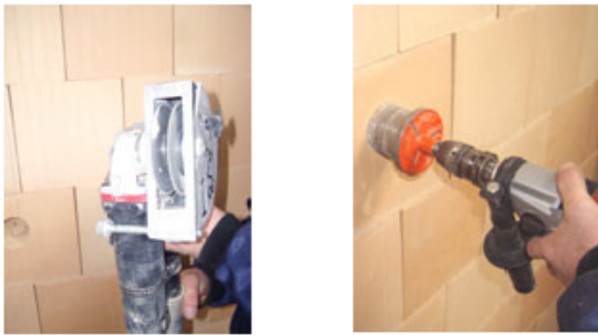
1. Werkzeug zum fachgerechten Schlitzen von Ziegelmauerwerk