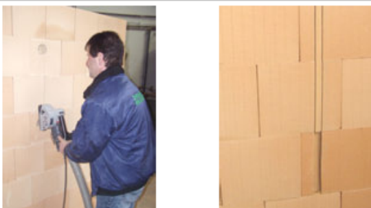
3. Schlitzen von Ziegel mit der Schlitzfräse